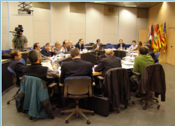
Reunión con los usuarios energéticos de la cuenca del Ebro (13/11/2007)

El PROCESO DE PARTICIPACIÓN ACTIVA se ha organizado mediante la convocatoria de foros o grupos de trabajo y mesas sectoriales y territoriales, que han permitido conocer cuales son los principales problemas presentes en la cuenca desde la óptica de los diversos usuarios, agentes del territorio y expertos del ámbito técnico-científico, así como su magnitud y el grado de afección ambiental, económica y social.