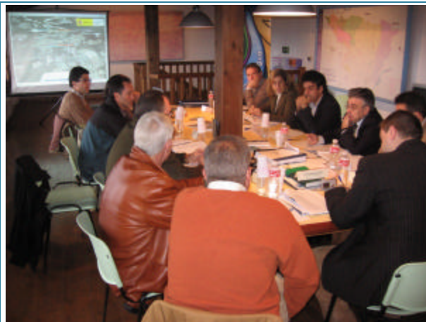
Sesión de Participación Pública con alcaldes del entorno del embalse del Ebro (28/11/2006)

El proceso de participación pretende refrendar, anular, ampliar o corregir el Borrador de Medidas para convertirlas en propuestas firmes a presentar al Consejo del Agua de la cuenca en la aprobación del Plan.