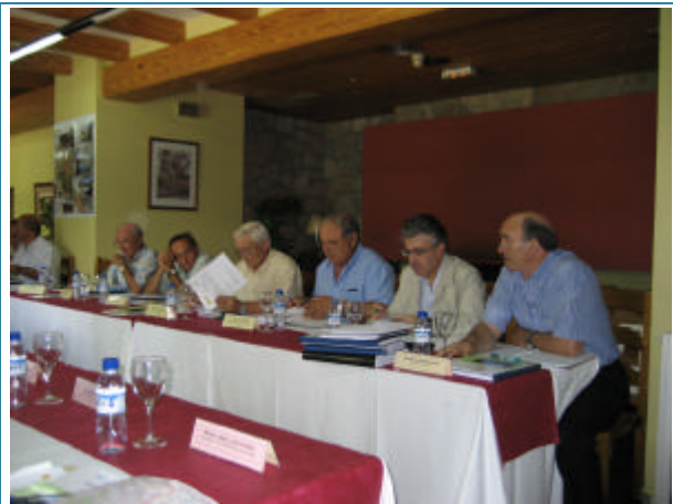
Sesión de Participación Pública con regantes de la cuenca del río Alcanadre (21/06/2007)

Otro resultado del proceso de participación por subcuencas y el correspondiente trabajo de síntesis y sistematización en gabinete, ha sido la elaboración de una Propuesta preliminar de actuaciones concretas que serán trasladadas al Consejo del Agua de la cuenca del Ebro para su incorporación en el Plan Hidrológico del año 2009. Las aportaciones de usuarios y agentes han permitido incorporar líneas de actuación que complementan las estrategias de las diversas Administraciones, contribuyendo a la superación de los problemas.