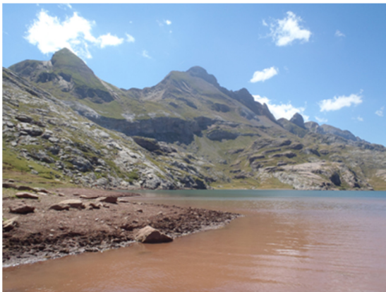
Turbidez en la zona litoral debida al sustrato arcilloso