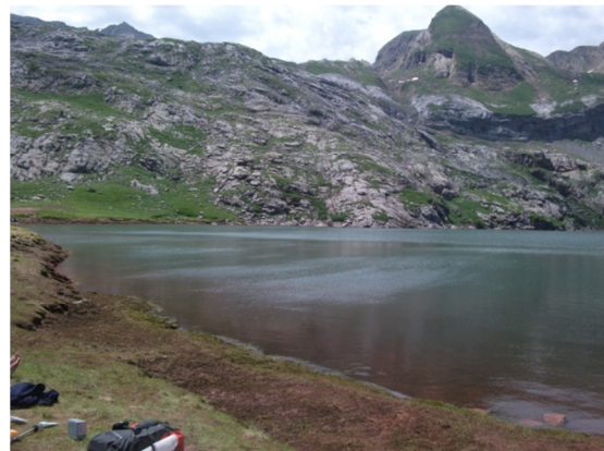
Vista del litoral en la zona de muestreo