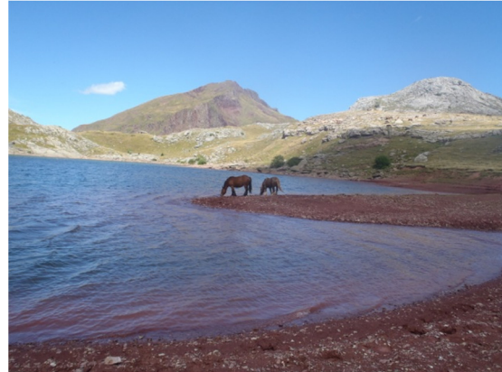
Caballos en el litoral del ibón