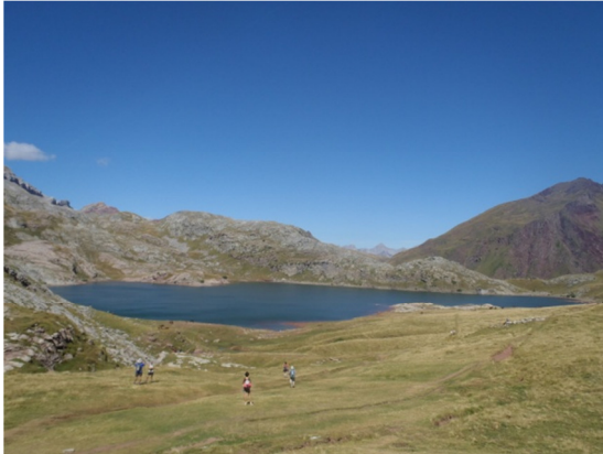
Vista del Ibón de Estanés